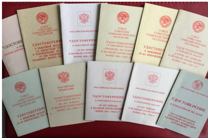
Наградные материалы Нефедова Н.И.